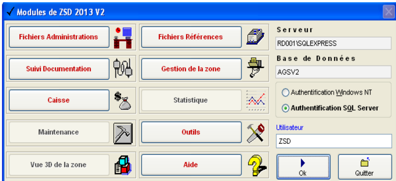
Figure1 : Ecran d'accueil

L'image suivante représente l'écran d'accueil de ZSD2013_V2: